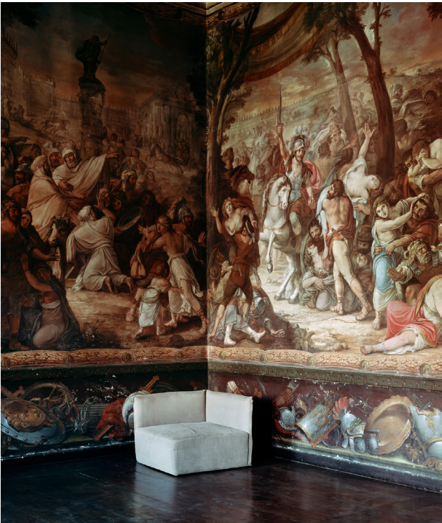
"AIM 008" da série "A Invenção da Memória" © João Paulo Serafim