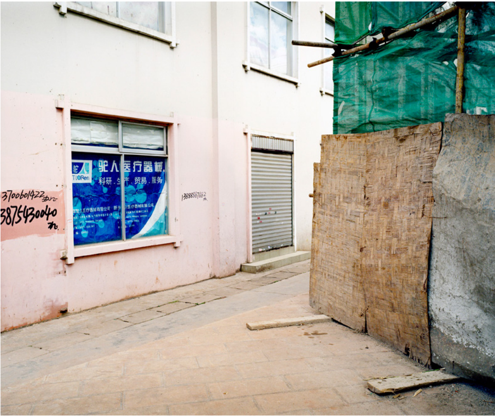
"Untitled" da série "Far Far East" © Carlos Lobo